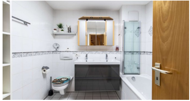
innenliegendes Badezimmer/WC im 1.OG