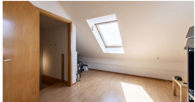
Studio im Dachgeschoss