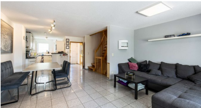
blick aus dem Wohnzimmer Richtung Küche