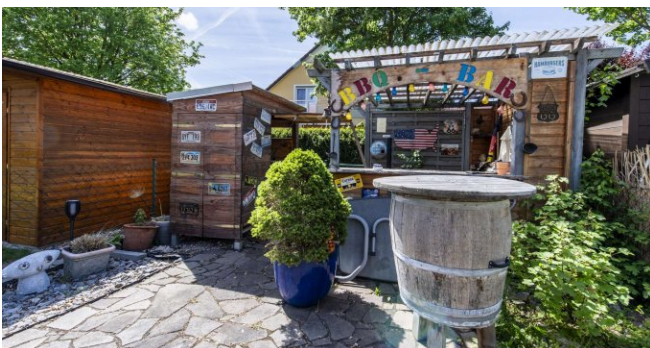
Bar Bereich im Garten