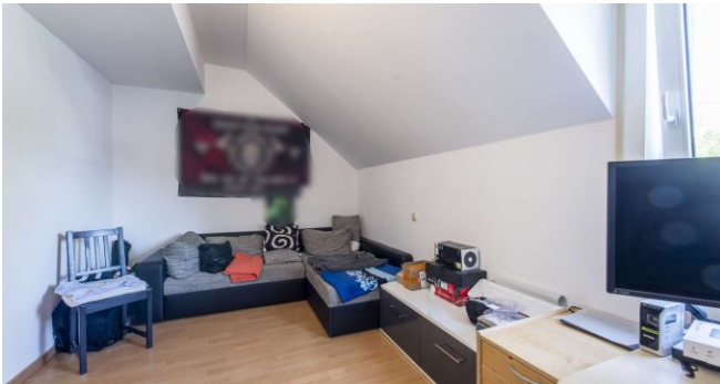
Gästezimmer im 1.OG